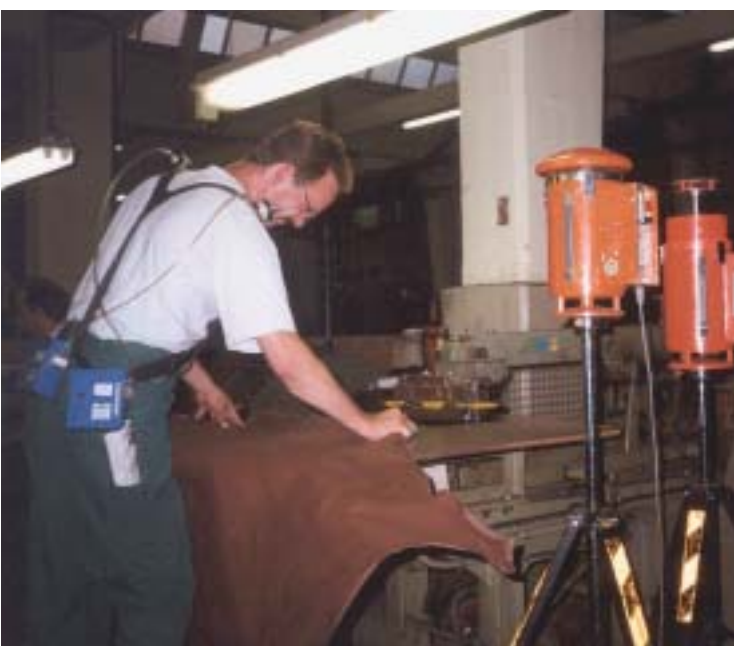
Abb. 1 Personenbezogene und stationäre Messung am Arbeitsplatz