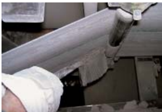
Abb. 1 Reinigung mit Handfeger