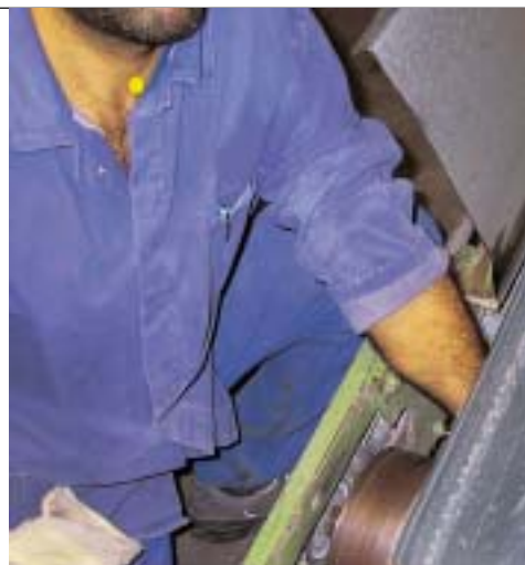
Abb. 2 Beseitigung von Schmutz beim laufenden Band

Ein Betriebsschlosser sollte den Schieflauf eines Fördergurtbandes durch Nachstellen der Spannschrauben an der Umlenkrolle ausgleichen. Nachdem er hierzu die seitlichen Schutzgitter gelöst hatte, begann er bei laufendem Band die Spannschrauben nachzuziehen. Hierbei rutschte er mit dem Gabelschlüssel ab und geriet mit der Hand in die Einzugsstelle.