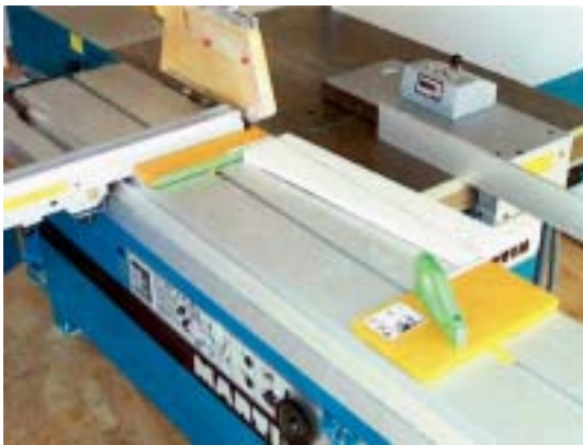
Wie ein „Fritz und Franz“ benutzt werden kann, zeigen die beiden Abbildungen.

Die neue Schutzvorrichtung „Fritz und Franz“ bietet nicht nur Schutz vor Unfällen an der Formatkreissäge, sondern gestattet es darüber hinaus, auch wesentlich ergonomischer und damit rückschonender zu arbeiten. Der etwas schräg gestellte Griff erlaubt eine bessere Kraftübertragung und eine aufrechte Körperhaltung und dadurch ein entspannteres und sichereres Arbeiten an der Formatkreissäge.