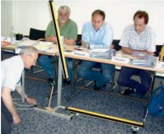
Demonstration einer berührungslos wirkenden Schutzeinrichtung.

Wie bereits in der Vergangenheit bietet die Lederindustrie Berufsgenossenschaft wieder Fortbildungsveranstaltungen für Sicherheitsfachkräfte an, um mitzuhelfen, unsere Ansprechpartner in den Betrieben auf den aktuellen Informationsstand im Arbeitsschutz zu bringen