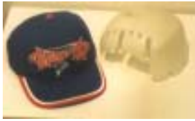
Abb.: Anstoßkappe, Ingenieurbüro Schwan, Frankfurt

In einem Mitgliedsunternehmen gab es seit längerem die Anweisung, in der Produktionshalle, in der ein Stetigförderer vorhanden war, Anstoßkappen aus Kunststoff als Kopfschutz zu tragen. Dies löste immer wieder Diskussionen aus. Schließlich gab es viele Arbeiten, bei denen auf den ersten Blick die Notwendigkeit, Anstoßkappen ständig zu tragen, nur schwer einzusehen war. Vor diesem Hintergrund ist ein Unfall zu sehen, der sich an einem Stetigförderer ereignete, der die Waren von der Produktionshalle zum Versand transportiert. An einer schwer zugänglichen Stelle fielen Teile herab. Ein Mitarbeiter, der dies be-