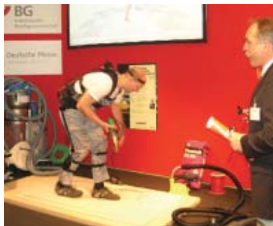
CUELA im Einsatz

Die Messebesucher konnten sich am Stand direkt bei der LIBG rund um das Thema „Praktischer Arbeits- und Gesundheitsschutz“ informieren. Auch gab es die Möglichkeit, sich zum Hautschutz beraten zu lassen.