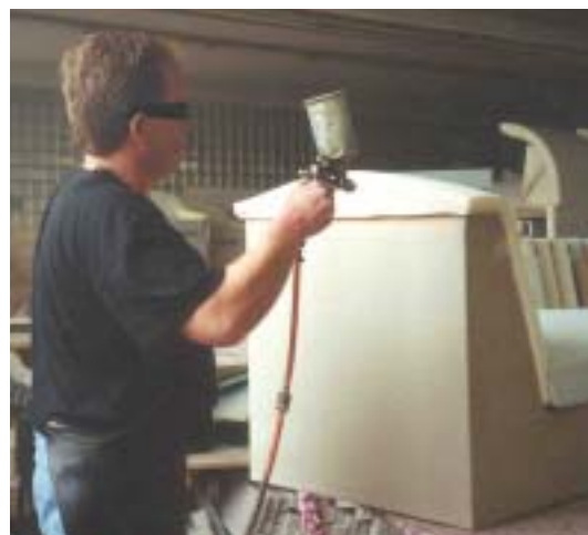
Abb.: Typische Hautgefährdung beim Umgang mit Klebstoffen

Da ein Zusammenhang mit der Arbeit als Polsterer nahe lag, wurde die Lederindustrie-Berufsgenossenschaft (LIBG) eingeschaltet. Ein Mitarbeiter der Präventionsabteilung der LIBG bot eine Beratung im Betrieb an, bei der die einzelnen Arbeiten des Mitarbeiters beurteilt werden sollten. Gemeinsam mit dem Betriebsarzt wurde ein Tätigkeitsprofil erstellt, das zeigte, mit welchen Arbeitsstoffen der Mitarbeiter Hautkontakt hat.