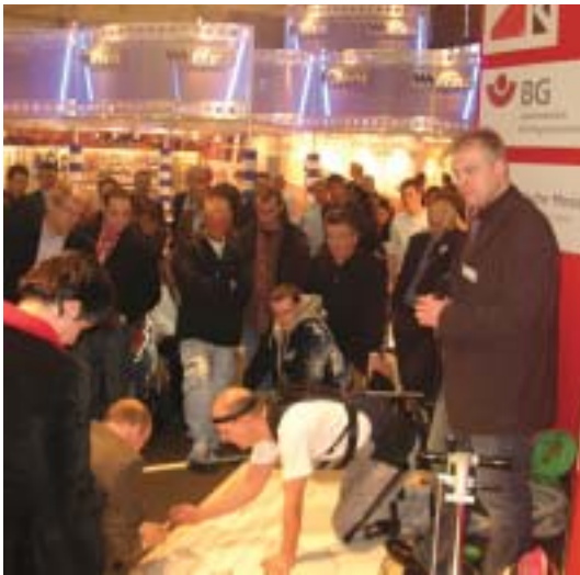
Der Aktionsstand war immer gut besucht

Auf der DOMOTEX 2008 in Hannover wurde mit den Fachbesuchern die „Aktion Sicheres Handwerk“ mit unterhaltsamen und informativen Vorführungen und Produktpräsentationen durchgeführt.