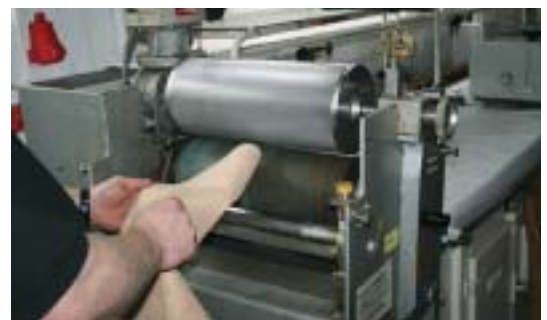
Abb. 2 Situation beim Reinigen – ohne Schutzvorrichtung

Reinigungsarbeiten an Walzenauftragsmaschinen werden von Hand mit einem Lappen durchgeführt. Hierzu wird die Schutzvorrichtung abgenommen und die untere Walze ca. 6 cm abgesenkt. Das Reinigen der Walzen muss im Stillstand, bei voneinander ausgefahrenen Walzen, durchgeführt werden. Nachdem die hartnäckigen Farbkrusten nicht entfernt werden konnten, schaltete ein Mitarbeiter die Maschine ein, um