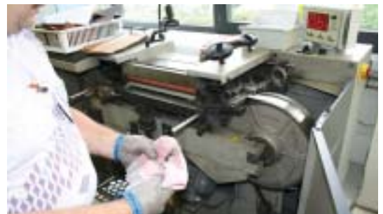
Abb. 2: Gliederketten-Handschuhe als Schutzmaßnahme