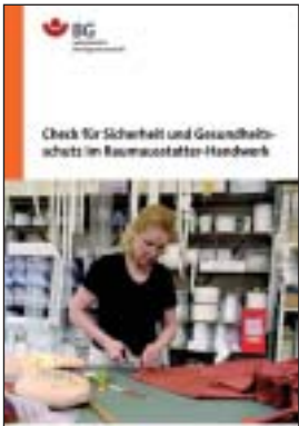
Der „Check für Sicherheit und Gesundheitsschutz im Raumausstatter-Handwerk“ ist das Ergebnis einer erfolgreichen Zusammenarbeit.

Ein Unternehmer, der für sichere und gesunde Arbeitsbedingungen sorgt, legt den Grundstein für ein zukunftsfähiges und wirtschaftlich gesundes Unternehmen. Sicherheit und Gesundheit am Arbeitsplatz gewährleisten – Schwachstellen erkennen und beseitigen – das sind Führungsaufgaben!