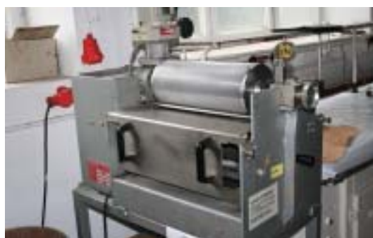
Abb. 1: Walzenauftragsmaschine mit Schutzvorrichtung

die Verunreinigungen bei sich drehenden Walzen schneller entfernen zu können. Durch Unachtsamkeit kam der Verletzte mit den Fingern zwischen die rotierenden Walzen. Es ist nicht zulässig, dass eine Maschine mit gefährbringenden Bewegungen ohne Schutzvorrichtungen eingeschaltet werden kann. Die LIBG prüft im Rahmen des Regresses, ob der Hersteller zu Recht das CE-Zeichen an der Maschine angebracht hat.