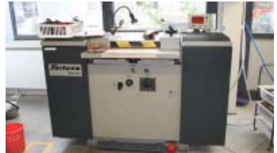
Abb. 1: Spaltmaschine für Leder

Beim Spalten von trockenem Leder sammelt sich zwischen der Umlenkrolle und dem Bandmesser Lederschmutz. Dieser verursacht eine nicht erwünschte Vibration des Messers. Eine gleichmäßige Spaltstärke kann in dem Fall nicht mehr eingehalten werden. Die Umlenkrollen des Bandmessers werden im Stillstand der Maschine von Hand mit Hilfe eines Lappens gereinigt. Wegen des sehr scharfen Messers ist das Entfernen des Schmutzes mit Verletzungsgefahren verbunden. In folgendem Fall rutschte ein Mitarbeiter bei Reinigungsarbeiten ab und geriet mit seiner rechten Hand in das scharfe Bandmesser. Er zog sich eine tiefe Schnittwunde zu. In dem Mitgliedsunternehmen werden nun Gliederketten-Handschuhe beim Reinigen an der Spaltmaschine eingesetzt. Ein solcher Unfall kann sich jetzt nicht mehr ereignen.