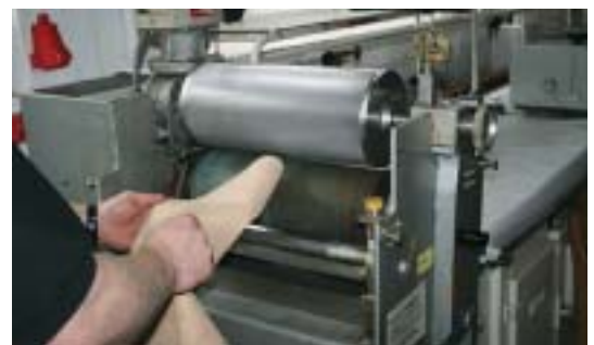
Abb. 2 Situation beim Reinigen – ohne Schutzvorrichtung

Reinigungsarbeiten an Walzenauftragsmaschinen werden von Hand mit einem Lappen durchgeführt. Hierzu wird die Schutzvorrichtung abgenommen und die untere Walze ca. 6 cm abgesenkt. Das Reinigen der Walzen muss im Stillstand, bei voneinander ausgefahrenen Walzen, durchgeführt werden. Nachdem die hartnäckigen Farbkrusten nicht entfernt werden konnten, schaltete ein Mitarbeiter die Maschine ein, um