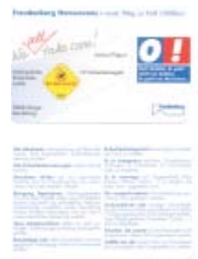
Sicherheitsstrategie und Sicherheitsregeln verdichtet auf eine Karte in Kreditkarten-Größe (Abbildung oben: Vorder- und Rückseite der Karte).

Unfälle, die heute bei FV noch passieren, sind fast immer auf einen Regelverstoß zurückzuführen. Im Umkehrschluss, wenn alle Mitarbeiter die Regeln einhalten, kommen wir unserem Ziel sehr nah.