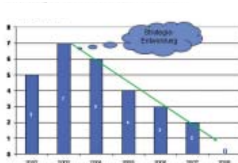
Entwicklung der schweren Unfälle bei FV weltweit (incl. Leasingmitarbeiter, Dienstleister, Fremdhändler und Lieferanten). Stand 31. August 2008

neben der Fachkompetenz die Sozial- und Methodenkompetenz stark weiterentwickelt werden. Die richtige Balance zwischen Dienstleister und Auditor zu finden, ist dabei eine der Herausforderungen.