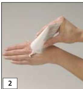
Abb. 6 Ekzeme treten zum größten Teil an den Händen auf, da diese am häufigsten den schädigenden Einflüssen ausgesetzt sind.

Abb. 5 Schutzhandschuhe: Die richtige Auswahl Handschuhe bieten den besten Schutz vor Feuchtigkeit, infektiösem Material und aggressiven Substanzen. Grundsätzlich gilt, dass ein Handschuh für die spezielle Tätigkeit geeignet sein muss.